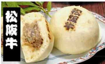
三重県。松阪饅頭工房みやび庵 松阪牛肉まん