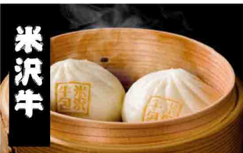
山形県 米澤紀伊国屋 米沢牛肉饅頭