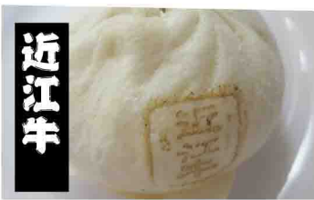
滋賀県 新名神・土山SA 近江牛肉まん