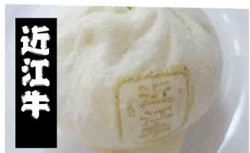
山形県 米澤紀伊国屋 米沢牛肉饅頭